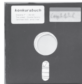
Geplantes Cover konkursbuch Nr. 22, Computer (in den Achtzigern). Die Herausgeber fürchteten, dass die bereits geschickten Beiträge bei Erscheinen schon nicht mehr aktuell gewesen wären, und zogen das Buch zurück.

konnten wir damals nicht, denn es gab noch keine PCs – es war also nur Zufall, dass es bei uns der Computer wurde, dass wir mit dem stabileren Gerät anfangen. Auf dem 8-Zeilen-Bildschirm ließ sich also eine Kundennummer eingeben, und wenn sie stimmte, erschien die Bestelladresse, dann mussten noch Bestellzeichen eingegeben werden, und dann wurden die Titel eingetiggert.